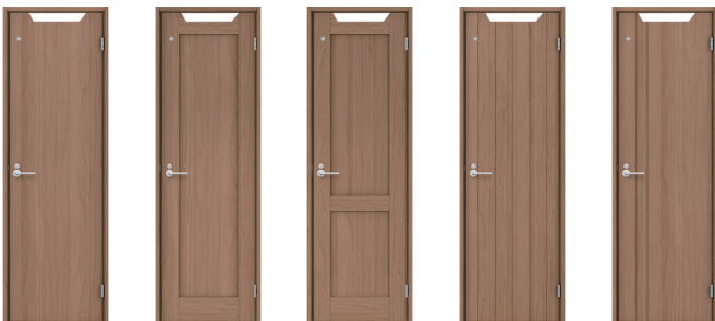
フラットデザイン 枠組デザイン 枠組デザイン スリットデザイン スリットデザイン